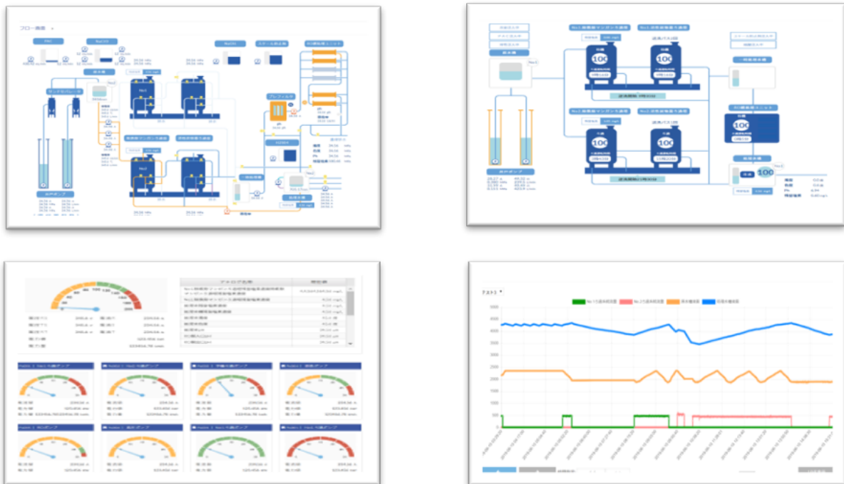
図：【Suizin(水神)】の画面イメージ