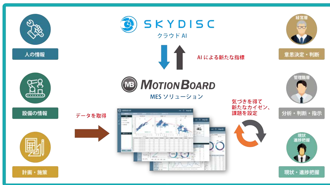
(図 1) サービスイメージ

このプラットフォームに統合されたデータに対して、予測分析など時系列データの解析モジュールを提供するスカイディスクの「SkyAI」を連携させ、蓄積したデータから AI 学習モデルを生成し、良品判定や設備の不良予測などをわかりやすく表示することができるサービス(図 1)を展開します。